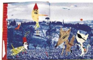
3.6 Diseño de sobrecubierta y páginas para el cuento infantil Pinocchio de Sara Fanelli. Sara Fanelli dio un giro completo a un clásico infantil tan lleno de posibilidades como Pinocchio , ilustrando esta historia popular con una estética muy novedosa.