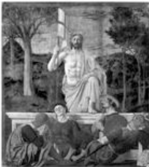
Piero della Francesca, La resurrección , 1467-1468.

Después de leer el Galileo de Bertolt Brecht estuve pensando sobre la incierta posición que ocupa el científico en la sociedad. Y se me ocurrió entonces que la del artista era muy distinta. El científico puede elegir entre revelar u ocultar los datos que sostienen su nueva hipótesis y le acercan a la verdad. En el caso de que tenga que luchar, tiene pruebas para cubrirse las espaldas. Pero para el artista, la verdad es variable. Se las tiene que arreglar con la versión concreta, la manera de mirar concreta que haya elegido. El artista no tiene con qué cubrirse las espaldas... solo cuenta con sus propias decisiones.